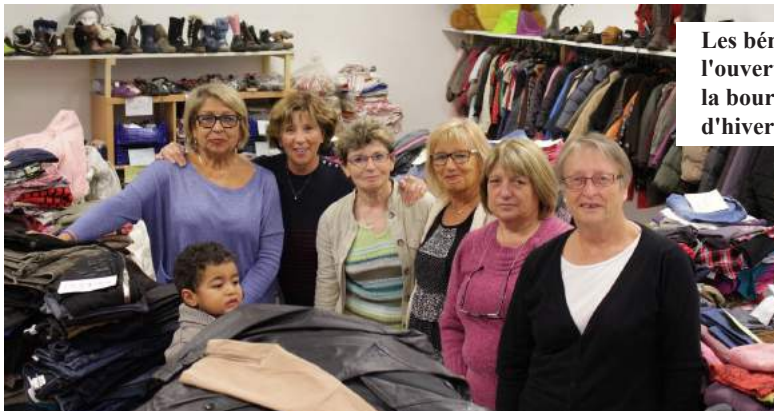
Les bénévoles avant l'ouverture au public de la bourse aux vêtements d'hiver

Quand on pense Centre Communal d'Action Sociale on pense bourse aux vêtements et colis alimentaire... Les élus et Les bénévoles qui travaillent au CCAS de Portets savent que c'est un engagement qui va au-delà de quelques rendez-vous annuels.