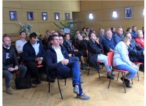
Les riverains du Courneau salle du Conseil Municipal.

Le Maire et son équipe se félicitent du succès de ces rencontres et de l'implication de tous, preuve que Portets reste une commune aimée par ses habitants toujours plus concernés et intéressés par leur proche environnement.