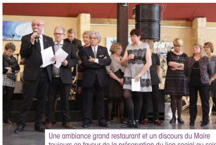
Une ambiance grand restaurant et un discours du Maire toujours en faveur de la préservation du lien social au sein de Portets