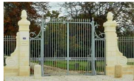
Le portail du château de l'Hospital réalisé par les Méalliers d'Épernon

Si vous passez devant le château de l'Hospital vous remarquerez à coup sûr l'imposant portail de l'entrée du domaine, et si vous continuez un peu plus loin, vous passerez devant la maison du Chéret avec son escalier et sa rambarde en fer forgée. Ces éléments du patrimoine du village ont en commun une entreprise : Les Méalliers d'Épernon. Deux réalisations qui sont un infime aperçu de l'immense savoir-faire de l'entreprise, qui après 21 ans passés à Cadillac a trouvé à Portets un endroit où travailler à son aise. Les Méalliers